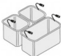
SET 1 CESTELLO GN1/3 - 2 CESTELLI GN1/6 TIKPCM704019