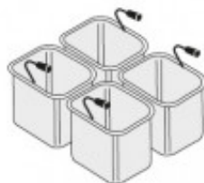
SET 4 CESTELLI GN1/6 PER CUOCIPASTA TIKPCM704018