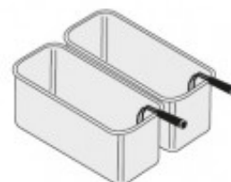
SET 2 CESTELLI GN2/6 PER CUOCIPASTA TIKPCM704017