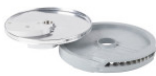
DISCO PER TAGLIO LISTELLI DIRITTI CON SPESSORE DI MILLIMETRI 8 X16 SOLO PER CL50D/52D/55D CL50D- E/ 52D - E /55D/ CL 50 GOURMET/ CL 60 - R502D -