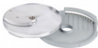
DISCO PER TAGLIO LISTELLI DIRITTI CON SPESSORE DI MILLIMETRI 10 X 16 SOLO PER CL 50-52-55D TL-60 MX60.28158