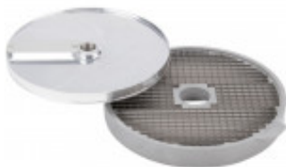
GRIGLIA CUBETTI E DISCO FETTA PER CUBETTO MM. 8 X 8 X 8 PER CL50D/52D/55D CL50D- E/52D - E /55D/ CL 50 GOURMET/ CL 60 - R502D - E- R602 - R652