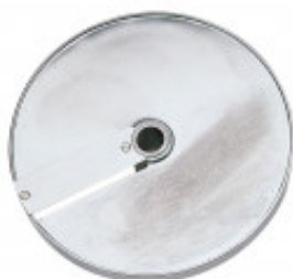
GRIGLIA CUBETTI E DISCO FETTA PER CUBETTO MM. 5 X 5 5 PER CL50D- E/52D - E /55D/ CL 50 GOURMET/ CL 60 - R502D - E- R602 - R652 MX60.28110