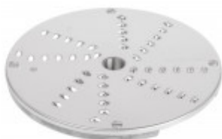
DISCO PER TAGLIO JULIENNE CON SPESSORE DI MILLIMETRI 4 PER CL50D/ 52D/55D CL50D- E/52D - E /55D/ CL 50 GOURMET/ CL 60 - R502D - E- R602 - R652