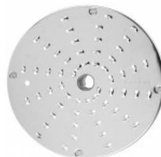
DISCO PER TAGLIO JULIENNE CON SPESSORE DI MILLIMETRI 3 PER CL50D/ 52D/55D CL50D- E/52D - E /55D/ CL 50 GOURMET/ CL 60 - R502D - E- R602 - R652