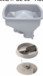
ACCESSORIO SCHIACCIAPATATE (SENZA TRAMOGGIA) DA 6MM PER CL50E MX60.28210