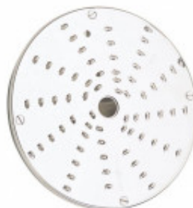
DISCO PER TAGLIO PATATE CRUDE PER R502/R502VV/ R602/R652/CL50- CL50U - CL 50GOURMET / CL52/CL55/ CL60 MX60.27219