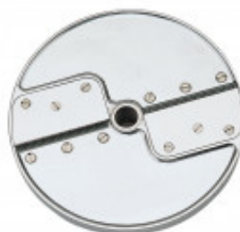
DISCO PER TAGLIO FIAMMIFERI CON SPESSORE DI MILLIMETRI 2 X 2 PER CL50D/52D/55D CL50D- E/52D - E /55D/ CL 50 GOURMET/ CL 60 - R502D -