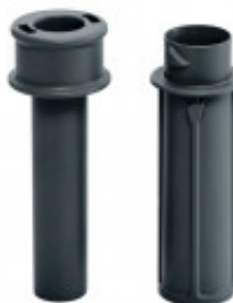
PRESSINO EXACTITUBE PER CL 50 - CL 50 ULTRA MX60.49212