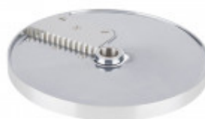
DISCO PER TAGLIO LISTELLI CURVI CON SPESSORE DI MILLIMETRI 6 X 6 PER CL50D/52D/55D CL50D- E/ 52D - E /55D/ CL 50 GOURMET/ CL 60 - R502D -