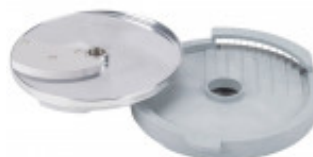
DISCO PER TAGLIO LISTELLI DIRITTI CON SPESSORE DI MILLIMETRI 8 X 8 SOLO PER CL50D/52D/55D CL50D- E/ 52D - E /55D/ CL 50 GOURMET/ CL 60 - R502D -