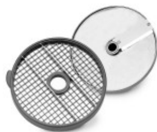
KIT CUBETTI SPECIFICO PER IL TAGLIO DELL'INSALATA CON DIMENSIONI 50 X 70 X 25 MM. PER CL50D/52D/55D CL50D- E/52D - E /55D/ CL 50