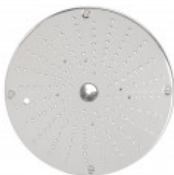
DISCO PER GRATTUGGIARE IL PANE ED IL FORMAGGIO PER CL50D/52D/55D CL50D- E/52D - E /55D/ CL 50 GOURMET/ CL 60 - R502D - E- R602 - R652