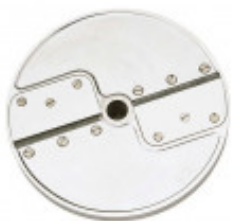
DISCO PER TAGLIO FETTE ONDULATE CON SPESSORE DI MILLIMETRI 5 PER CL50D/ 52D/55D CL50D- E/52D - E /55D/ CL 50 GOURMET/ CL 60 - R502D - E- R602 - R652