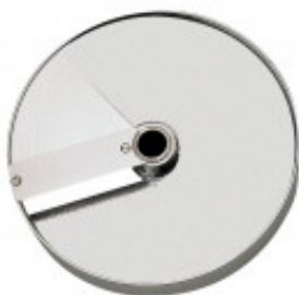
GRIGLIA CUBETTI E DISCO FETTA PER CUBETTO MM. 20 X 20 X 20 PER CL50D/52D/ 55D CL50D- E/52D - E /55D/ CL 50 GOURMET/ CL 60 - R502D - E- R602 - R652