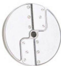
DISCO PER TAGLIO FIAMMIFERI CON SPESSORE DI MILLIMETRI 3 X 3 PER CL50D/52D/55D CL50D- E/52D - E /55D/ CL 50 GOURMET/ CL 60 - R502D -