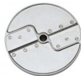
DISCO PER TAGLIO STRISCE CON SPESSORE DI MILLIMETRI. 2 X 6 PER CL50D/52D/55D CL50D- E/ 52D - E /55D/ CL 50 GOURMET/ CL 60 - R502D -