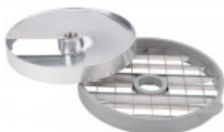
GRIGLIA CUBETTI E DISCO FETTA PER CUBETTO MM. 25 X 25 X 25 PER CL50D/52D/ 55D MX60.28115