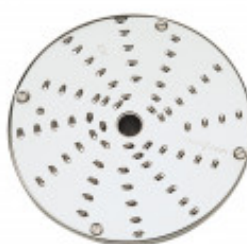
DISCO PER TAGLIO JULIENNE CON SPESSORE DI MILLIMETRI 2 PER CL50D/ 52D/55D CL50D- E/52D - E /55D/ CL 50 GOURMET/ CL 60 - R502D - E- R602 - R652