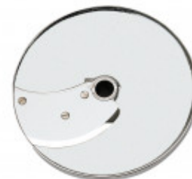
DISCO PER TAGLIO LISTELLI DIRITTI CON SPESSORE DI MILLIMETRI 10 X 10 SOLO PER CL 50-52-55D TL-60 MX60.28135