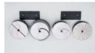
PORTA DISCHI A PARETE 4 ASTE INOX MX60.107812