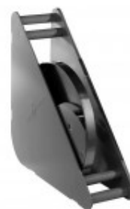
CONTENITORE DISCHI IN POLICARBONATO ADATTO A DISCHI PER R502 E R602/ CL50 E CL60 MX60.27258