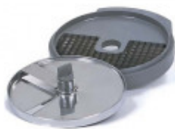
GRIGLIA CUBETTI E DISCO FETTA PER CUBETTO MM. 14 X 14 X 10 PER CL50D/52D/ 55D CL50D- E/52D - E /55D/ CL 50 GOURMET/ CL 60 - R502D - E- R602 - R652