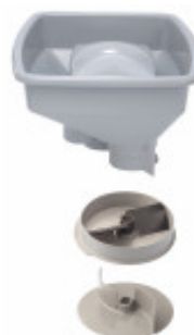
ACCESSORIO SCHIACCIAPATATE COMPLETO DA 3MM PER CL50E E CL50E ULTRA MX60.28207