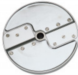
DISCO PER TAGLIO FIAMMIFERI CON SPESSORE DI MILLIMETRI 4 X 4 PER CL50D/52D/55D CL50D- E/52D - E /55D/ CL 50 GOURMET/ CL 60 - R502D -