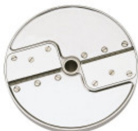
DISCO SPECIALE PER CIPOLLE CON SPESSORE DI MILLIMETRI 1X26 PER CL50D/52D/55D CL50D- E/ 52D - E /55D/ CL 50 GOURMET/ CL 60 - R502D -