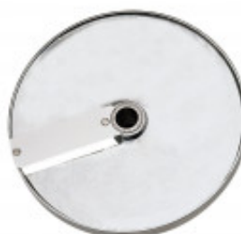
GRIGLIA CUBETTI E DISCO FETTA PER CUBETTO MM. 10 X 10 X 10 PER CL50D/52D/ 55D CL50D- E/52D - E /55D/ CL 50 GOURMET/ CL 60 - R502D - E- R602 - R652