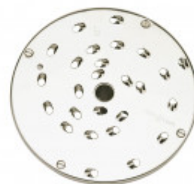
DISCO PER SFILACCIARE LA MOZZARELLA CON CON SPESSORE DI MILLIMETRI 9 PER CL50D/52D/55D CL50D- E/52D - E /55D/ CL 50 GOURMET/ CL 60 - R502D -