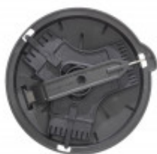
D-CLEAN KIT PER PULIZIA GRIGLIE PER TAGLIO CUBETTI MX60.39881