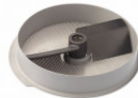
ACCESSORIO SCHIACCIAPATATE (SENZA TRAMOGGIA) DA 3MM PER CL50E E CL50E ULTRA MX60.28208