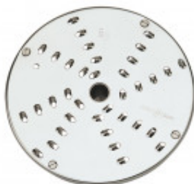
DISCO PER TAGLIO JULIENNE CON SPESSORE DI MILLIMETRI 5 PER CL50/ 52/55/60 - R502/602 MX60.28059