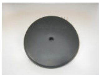
PROTEZIONE DISCHI PER DISCHI R502 A R602 E CL50 A CL60 MX60.39726