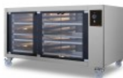
CELLA DI LIEVITAZIONE DC7020150005